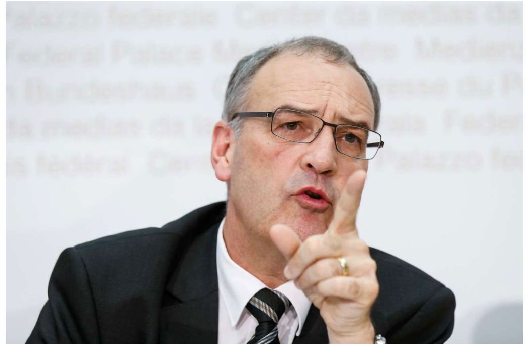
Bundesrat Guy Parmelin